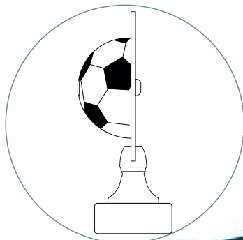
DETTAGLIO PROFILO TORNADO